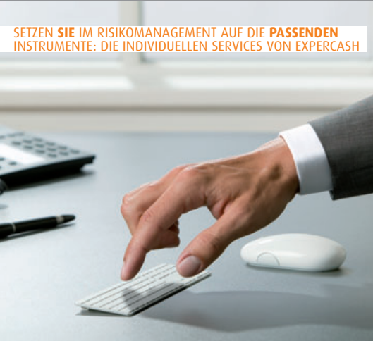
SETZEN SIE IM RISIKOMANAGEMENT AUF DIE PASSENDEN INSTRUMENTE: DIE INDIVIDUELLEN SERVICES VON EXPERCASH

EINE SOLIDE ADRESSPRÜFUNG IST DIE BASIS JEDER KUNDENBEZIEHUNG